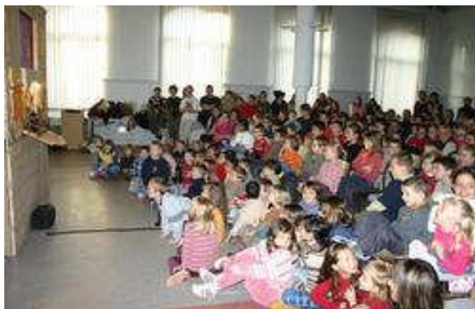
Le théâtre de marionnettes a toujours du succès.(Photo DNA)

© Dernières Nouvelles D'alsace, Mardi 13 Décembre 2005.. Tous droits de reproduction réservés