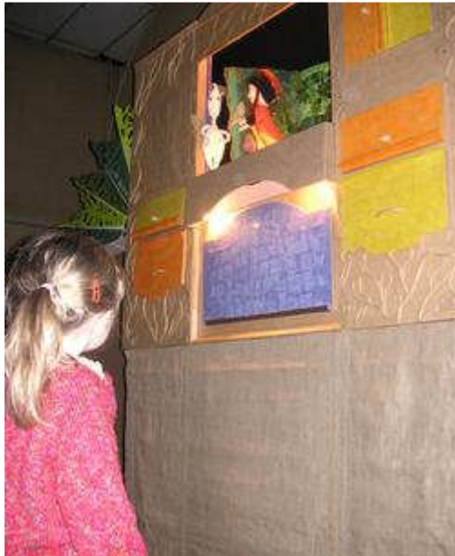
Le spectacle a attiré plus de 120 spectateurs.