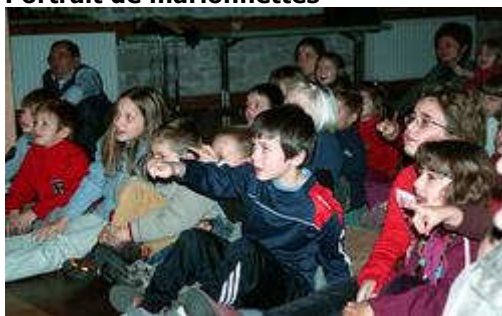
Des enfants admiratifs.

Dans le cadre des onze jours du portrait, la bibliothèque municipale a accueilli la Cie de La Loupiote et, comme c'est pratiquement le cas pour toutes les animations organisées dans ce cadre, toutes les places ont été réservées d'avance.