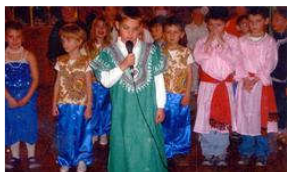
«L'Ile aux enfants» et l'école se sont associés pour fêter Noël. (-)