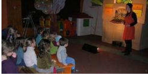
Des enfants captivés par l'histoire racontée par la marionnette.