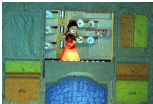
Les enfants n'ont pas perdu une miette du spectacle.